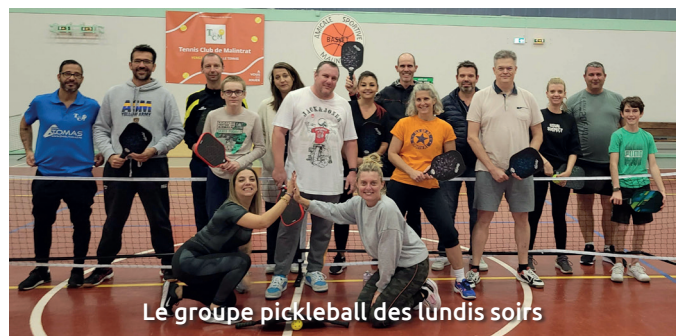
Le groupe pickleball des lundis soirs