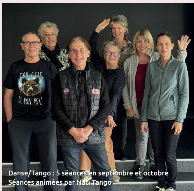
Danse/Tango : 5 séances en septembre et octobre Séances animées par Natu Tango