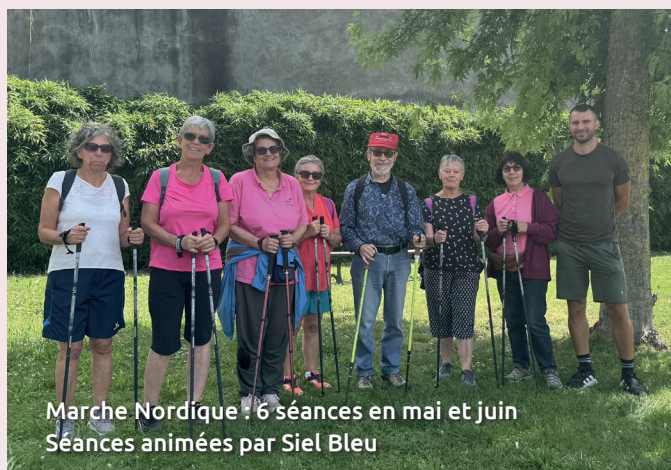
Marche Nordique : 6 séances en mai et juin Séances animées par Siel Bleu

Au cours de l'année 2025, le CLIC a ainsi permis la mise en place d'ateliers variés, dont la plupart ont rencontré un franc succès. Découvrez en image les différentes thématiques abordées :