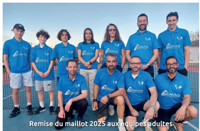
Remise du maillot 2025 aux équipes adultes

Pour nous contacter : Mathieu GOURCY ✉ tcmalintrat@gmail.com ☎ 06 81 53 46 76 www.ballejaune.com/club/malintrat