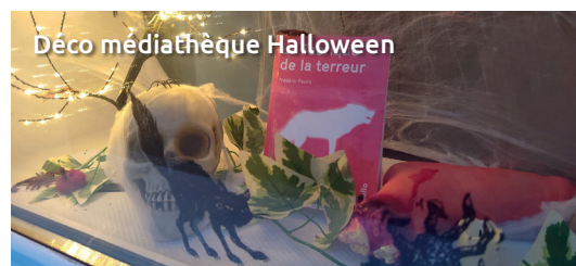
Déco médiathèque Halloween