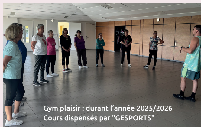
Gym plaisir : durant l'année 2025/2026 Cours dispensés par "GESPORTS"

Pour les ateliers et animations 2026 contacter la mairie ou consulter régulièrement votre application PanneauPocket.