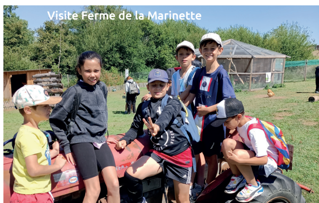
Visite Ferme de la Marinette