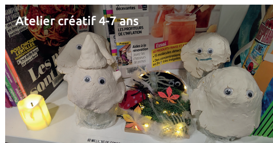
Atelier créatif 4-7 ans

Une année riche, conviviale et inspirante, qui donne déjà envie de découvrir ce que 2026 nous réserve à la médiathèque de Malintrat.