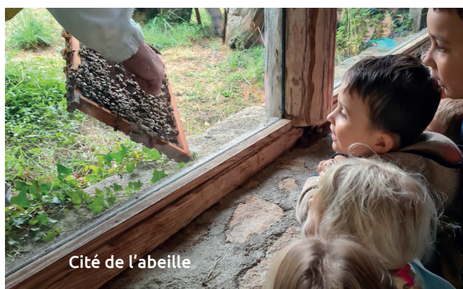
Cité de l'abeille