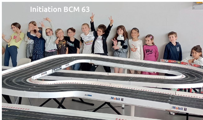
Initiation BCM 63