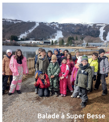
Balade à Super Besse