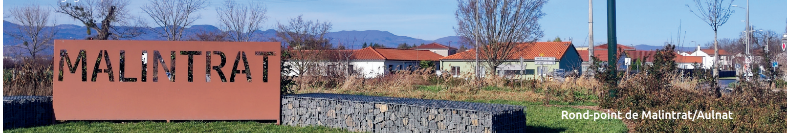
Rond-point de Malintrat/Aulnat

Dans un souci constant de renforcement de la sécurité, un poteau incendie a été installé avenue de la Motte pour un montant de 6 152 € .