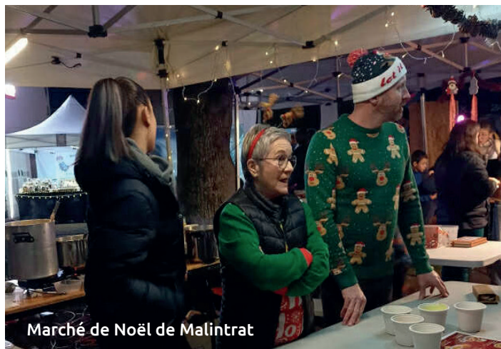
Marché de Noël de Malintrat