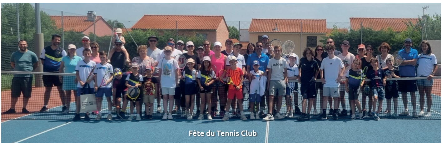
Fête du Tennis Club