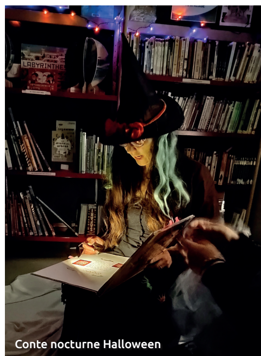
Conte nocturne Halloween