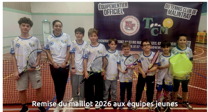
Remise du maillot 2026 aux équipes jeunes