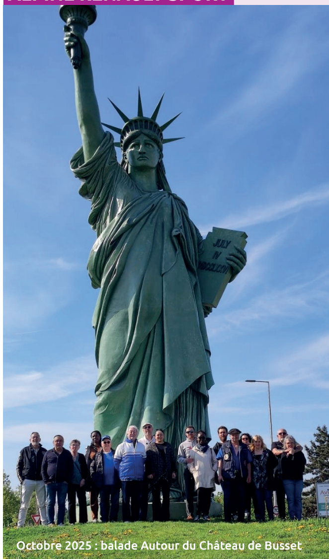
Octobre 2025 : balade Autour du Château de Busset

Cette année encore a été chargée en activités diverses et variées. Des journées circuit en partenariat avec « Les amis de Françoise » en faveur des enfants malades et de leurs parents et aidants, de magnifiques balades pleines de bonne humeur et de convivialité ainsi que de grands rassemblements comme au Château de Busset et la présence de Jean Ragnotti.